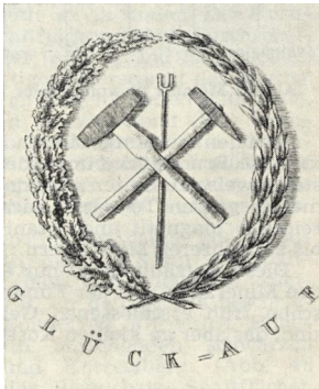
Siegelbild des früheren Badischen Bergwerksvereins um 1840 (GLA Karlsruhe Nr. 237/32516)

Allen Mitgliedern und freiwilligen Helfern sei für die Unterstützung im vergangenen Jahr recht herzlich gedankt. Der Vorstand wünscht allen ein frohes, gesegnetes Weihnachtsfest und ein herzliches Glückauf für das Sammeljahr 2016 .